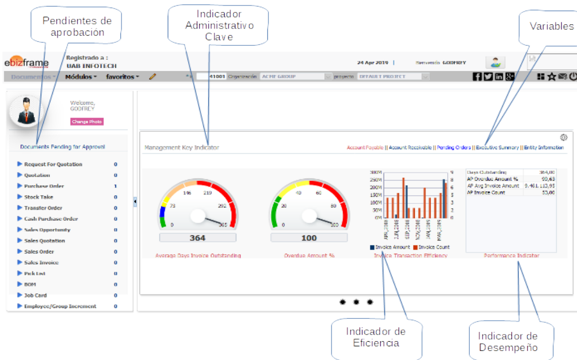
Ejemplo Tablero de Indicadores

Todo esto junto permite a la organización responder rápidamente a los estímulos internos o externos, garantizando que siempre sea competitivo y receptivo a sus clientes, proveedores u otros miembros de su ecosistema.